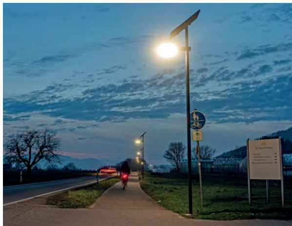
Sehr willkommen sind die Solarleuchten entlang des Radwegs vom Markhof nach Herten.

Einhellig begrüßt werden jedenfalls die beiden Solarleuchten auf dem Minsler Radweg, die an zwei unübersichtlichen, kurvigen Stellen angebracht sind und nun richtig gutes Licht geben. (lo)