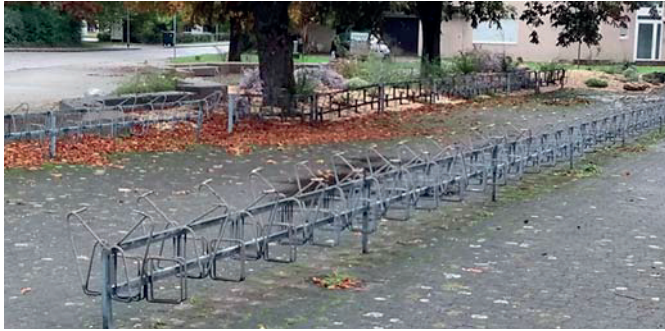
Immer noch Felgenklemmer, im Jahr 2020 – hier vor dem Freibad. Und warum, zum Beispiel, gibt es (Bild unten) nichts zum Anschließen vor der Sparkasse?

da sie nur über eine steile Rampe zu erreichen sind, werden sie eher wenig genutzt.