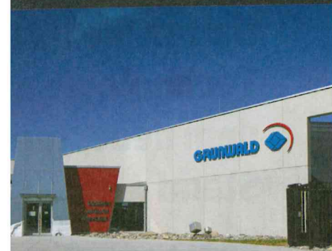
d GmbH, Wangen (D)