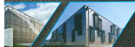
ar GmbH n (D)